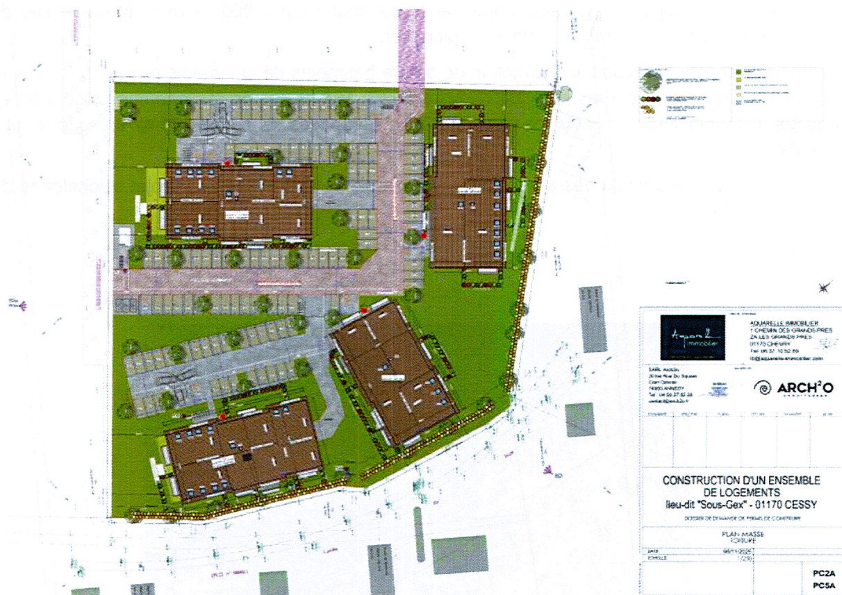
Figure 3: Plan de masse des toitures du projet immobilier porté par Aquarelle Immobilier – Phase 2