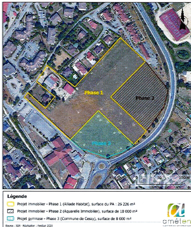
Figure 2: Phasage du projet d'ensemble

La réalisation de l'ensemble des aménagements des différentes phases du projet s'échelonne de fin 2025 et à 2029.